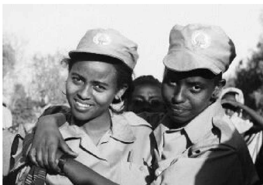
Fotografía de Ryszard Kapuscinski incluida en la muestra