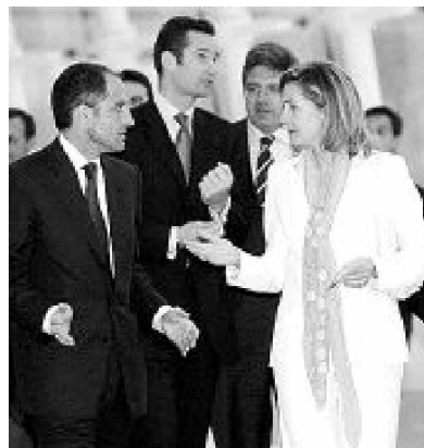
S.A.R. la Infanta Doña Cristina de Borbón y Don Iñaki Urdangarín junto a Francisco Camps, Presidente de la Comunidad Valenciana