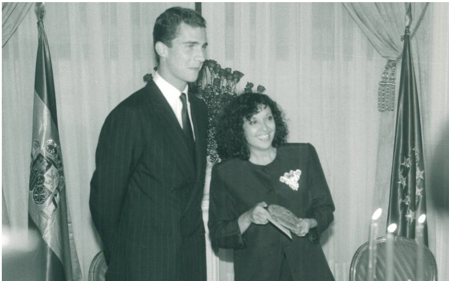
La premiada Maruja Torres posa sonriente junto a SAR el Príncipe de Asturias