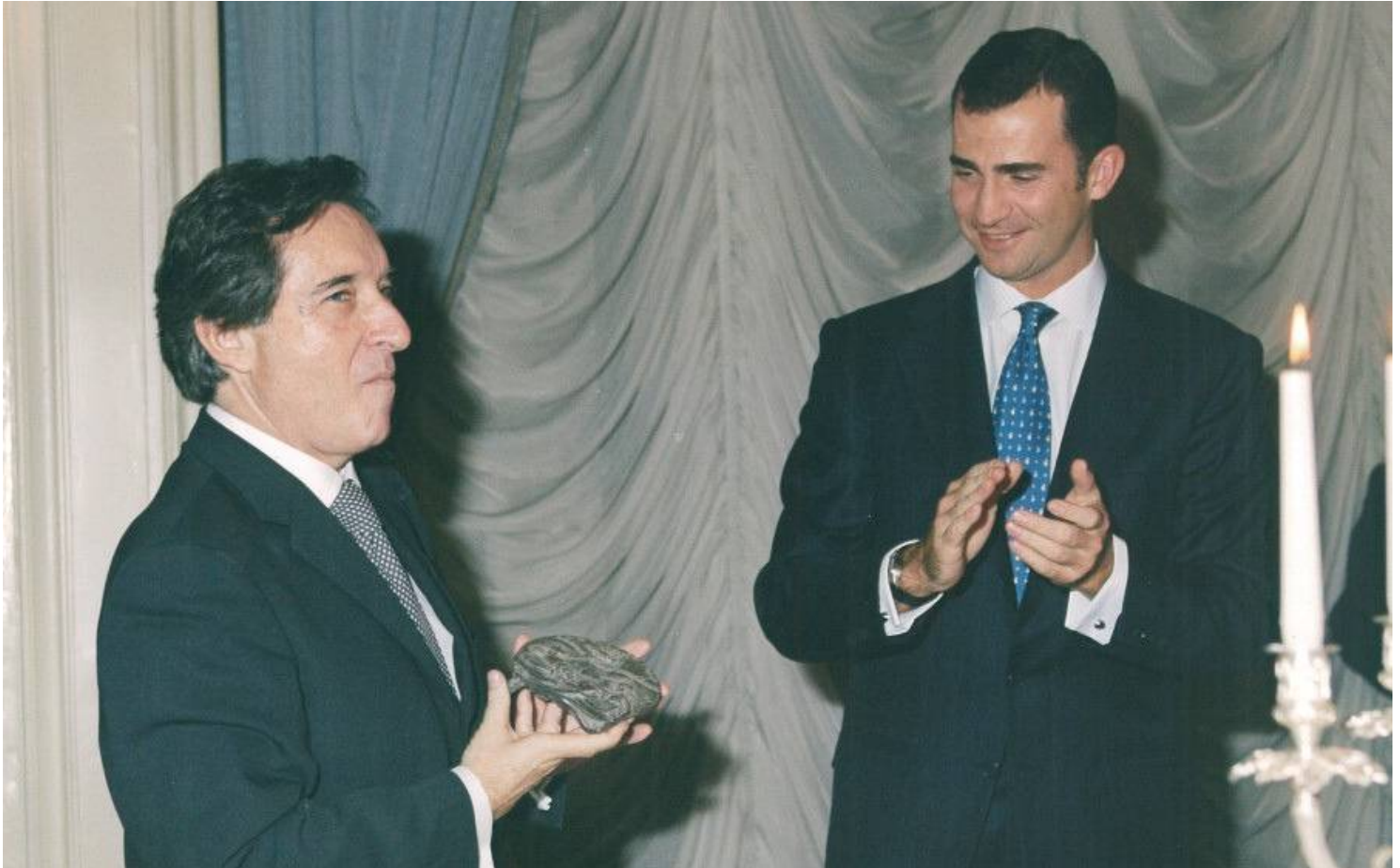
Iñaki Gabilondo posa con el galardón ante la mirada de SAR el Príncipe de Asturias

El jurado del Premio Cerecedo consideró a Iñaki Gabilondo como "el exponente máximo del periodismo libre y un ejemplo de objetividad, esa virtud que sólo practican aquellos que no temen la soledad".