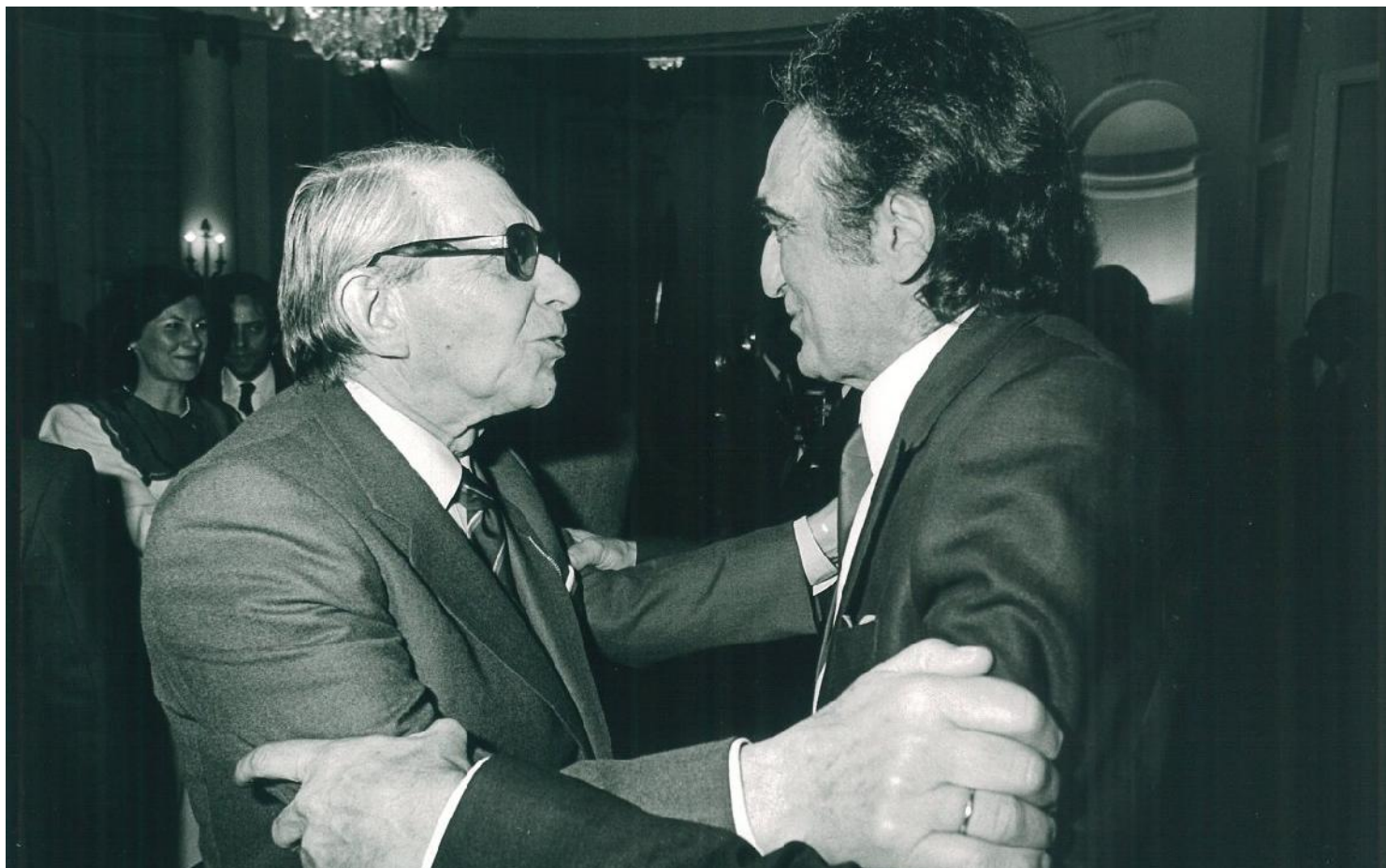
Gonzalo Torrente Ballester, Presidente del Jurado, y Rafael Sánchez Ferlosio se saludan afectuosamente durante la ceremonia de entrega

El jurado del premio destacó "la originalidad y hondura de la amplia obra periodística de Rafael Sánchez Ferlosio, que constituye una constante aproximación a las cuestiones más candentes de la sociedad moderna"