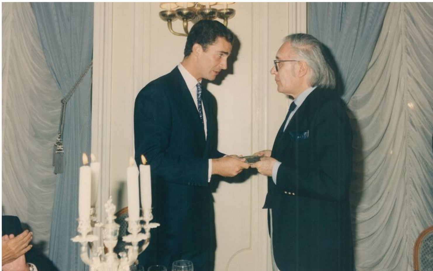
SAR Felipe de Borbón entrega el galardón a Francisco Umbral

Francisco Umbral fue distinguido por el jurado, entre otros méritos, debido a la «invención no sólo de un estilo nuevo de artículo periodístico brillante y retador, sino también de un acervo de palabras y giros sintácticos de excelentísimos resultados...».