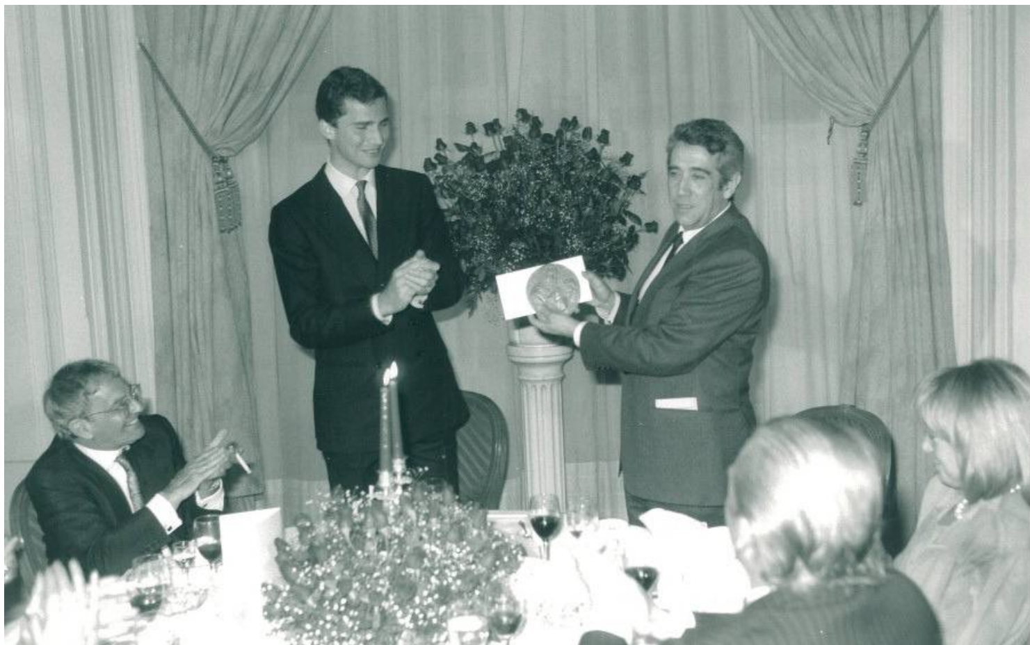
Chumy Chúmez muestra la medalla conmemorativa del Premio

SAR dijo de Chumy que "sus dibujos y sus textos han transgredido muchos tópicos, y han dado siempre muestra de una imaginación creadora, fértil en hallazgos inteligentes. Los dibujos de Chumy-Chúmez son liberadores de energía, permanecen ajenos a toda rigidez formal, quiebran la monotonía de la vulgaridad y sirven de antídoto a las alienaciones.