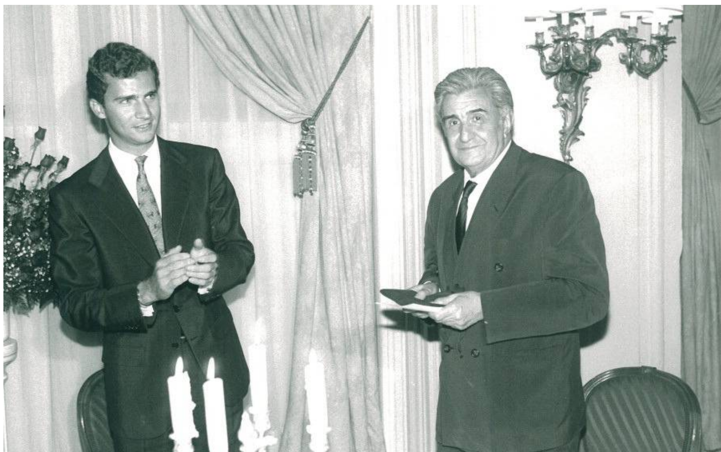
SAR el Príncipe de Asturias aplaude al galardonado, Eduardo Haro Tecglen

El jurado destacó del galardonado "la ironía piadosa, nunca descompuesta hasta el sarcasmo, con que penetra en los adentros de la realidad dominante; su perplejidad salvadora ante aquello que llamamos realidad; su caluroso escepticismo; la sencilla perfección de su lenguaje y el circunspecto desconsuelo con el que parece escribir"