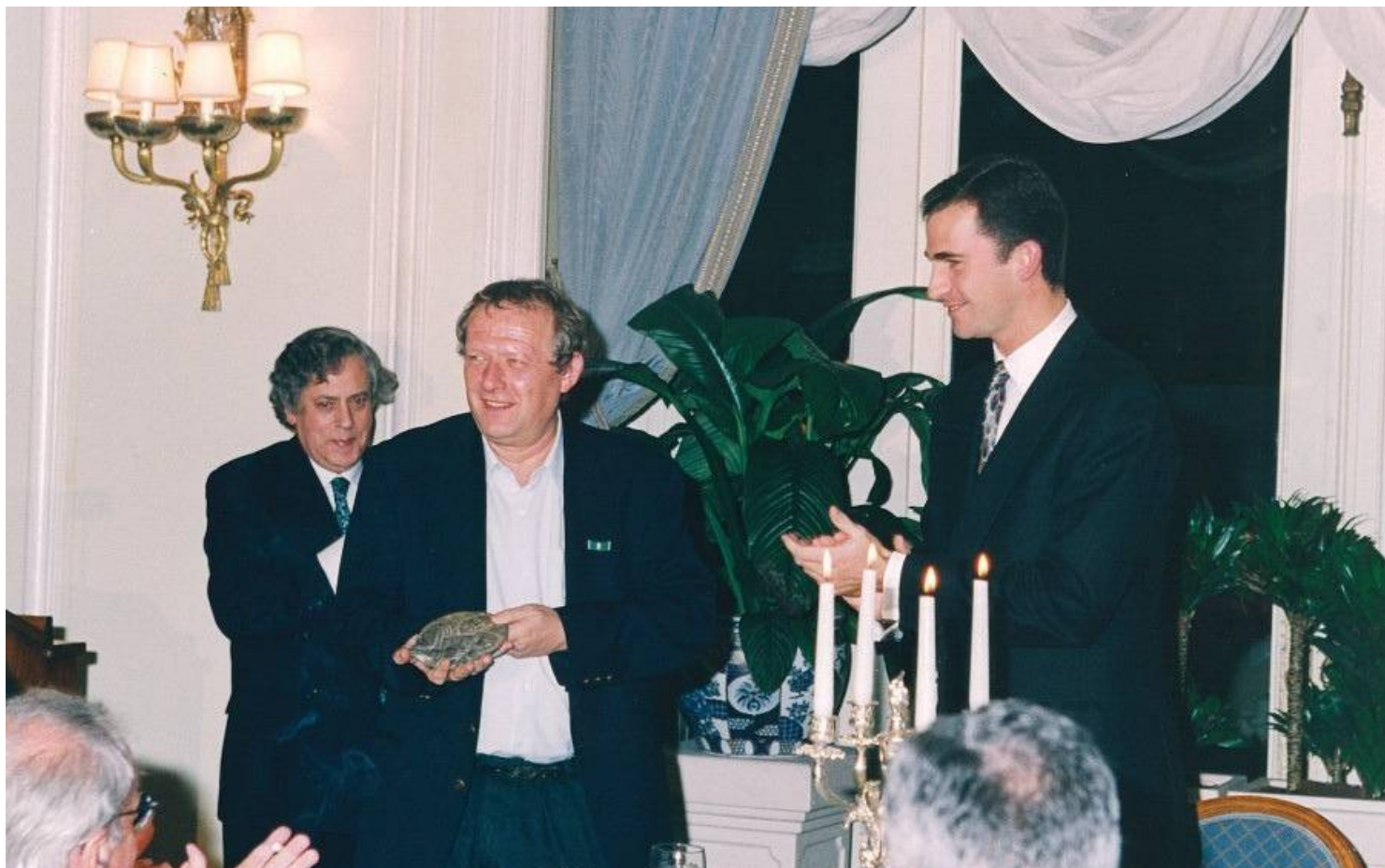
Adam Michnik posa con el galardón y recibe el aplauso de SAR el Príncipe de Asturias

De Michnik, SAR el Príncipe de Asturias dijo que "sus libros no sólo prueban el vigor de pensamiento y la precisión de compromiso de Michnik, sino que reflejan también el sueño de una Polonia reconciliada; sueño que él y hombres como él hicieron posible, y que enlaza con el sueño prometedoramente en marcha hacia la libertad de una Europa unida".