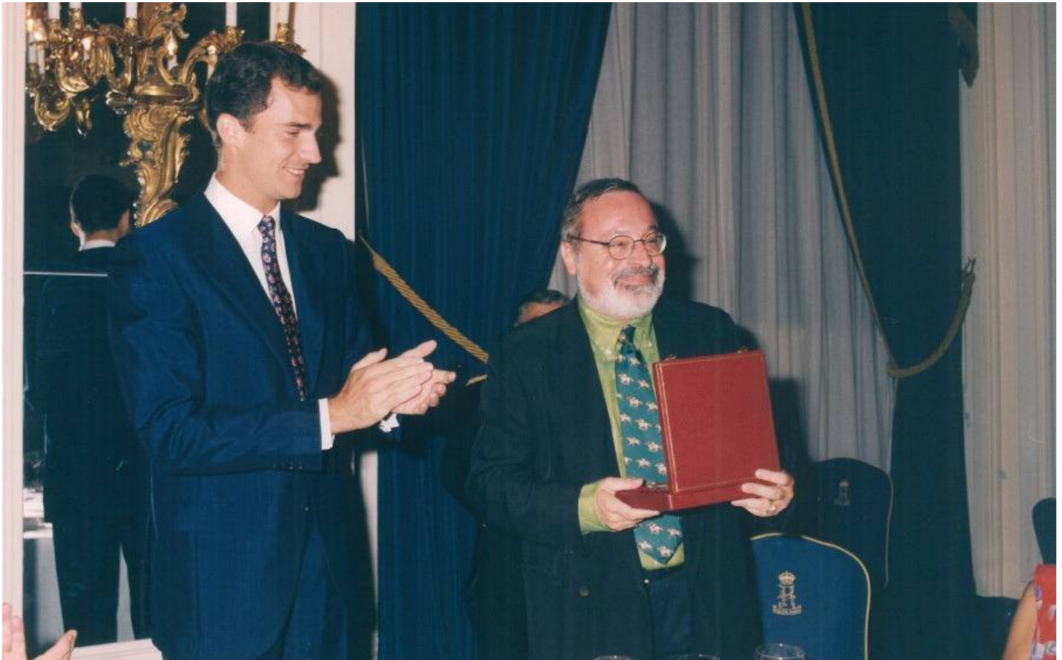
SAR Felipe de Borbón y Fernando Savater posando con el Premio

Según SAR, "en Fernando Savater concurren las cualidades del catedrático y el escritor con sus prestigiosas incursiones en el mundo del periodismo. Es, por tanto, un comunicador nato que expresa, con afán incansable, todas las posibilidades de difundir su claro, profundo y agudo pensamiento, presidido por un sentido ético que ha profesado durante largos años".