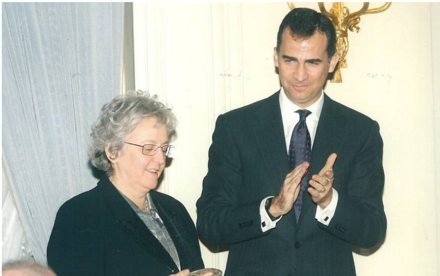
Soledad Gallego-Díaz recibe el galardón de S.A.R. el Príncipe de Asturias

El jurado destacó de la galardonada "su independencia de criterio, la inteligencia de su escritura, de sus valoraciones, y esa mezcla tan inusual de originalidad y sentido de la realidad que la define"