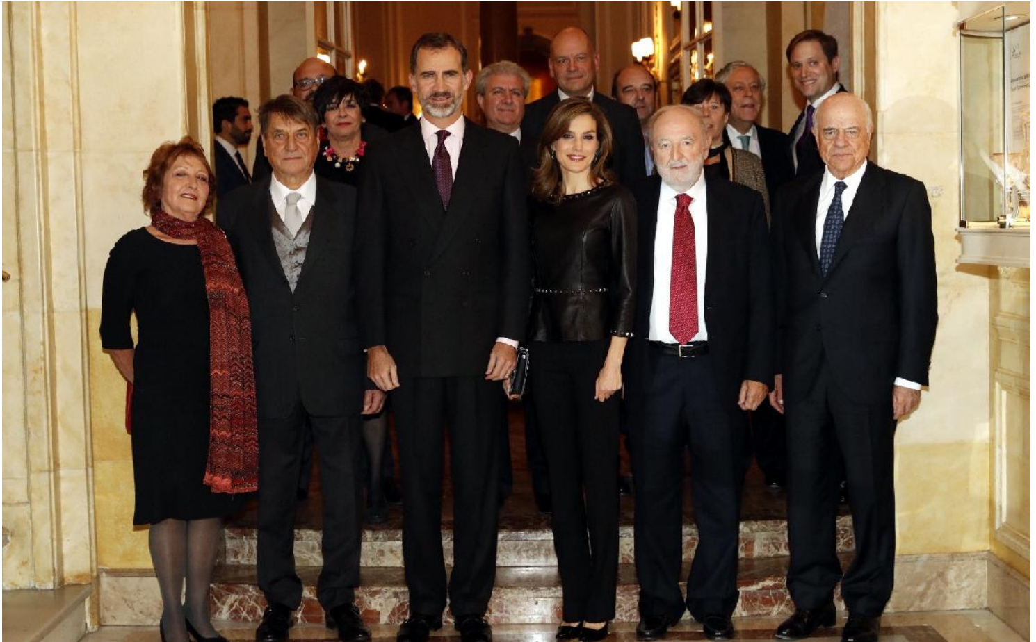
SSMM los Reyes posan con Claudio Magris, el Presidente del BBVA, Francisco González y los miembros del jurado

El fallo del Jurado destacó su espíritu europeísta y su labor en defensa del espacio común europeo y de las libertades democráticas. Además, valoró las extraordinarias lecciones de humanidad y concordia que se desprenden tanto de su extensa obra ensayística y de creación literaria.