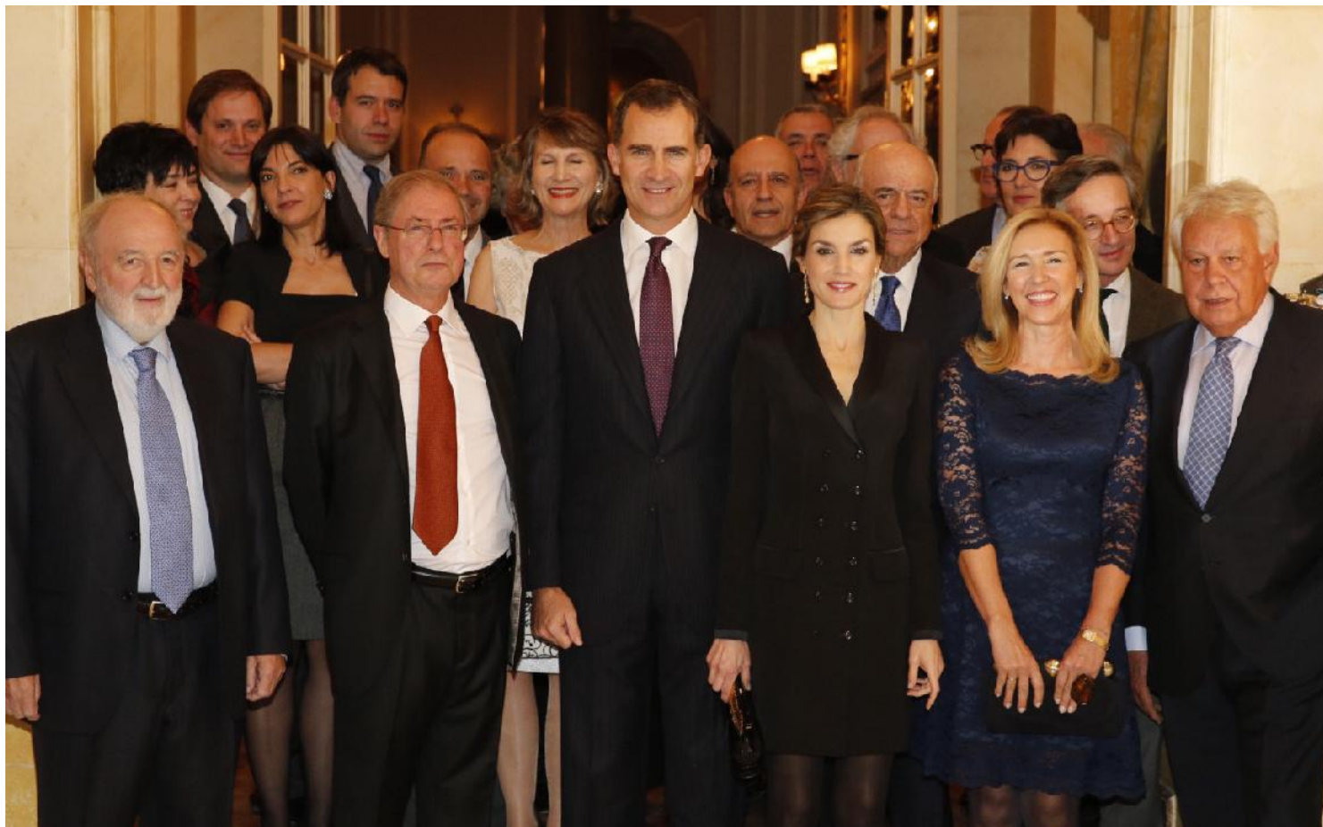
Sus Majestades los Reyes posan con el galardonado, los miembros del Jurado, el presidente del BBVA y algunas autoridades

El jurado destacó su capacidad para analizar la realidad con agudeza, por aguijonear las conciencias y romper solemnidades con un humor corrosivo. Sus ensayos y tribunas dejan sobrada constancia de su irrenunciable defensa de la libertad de conciencia y el derecho a la convivencia.