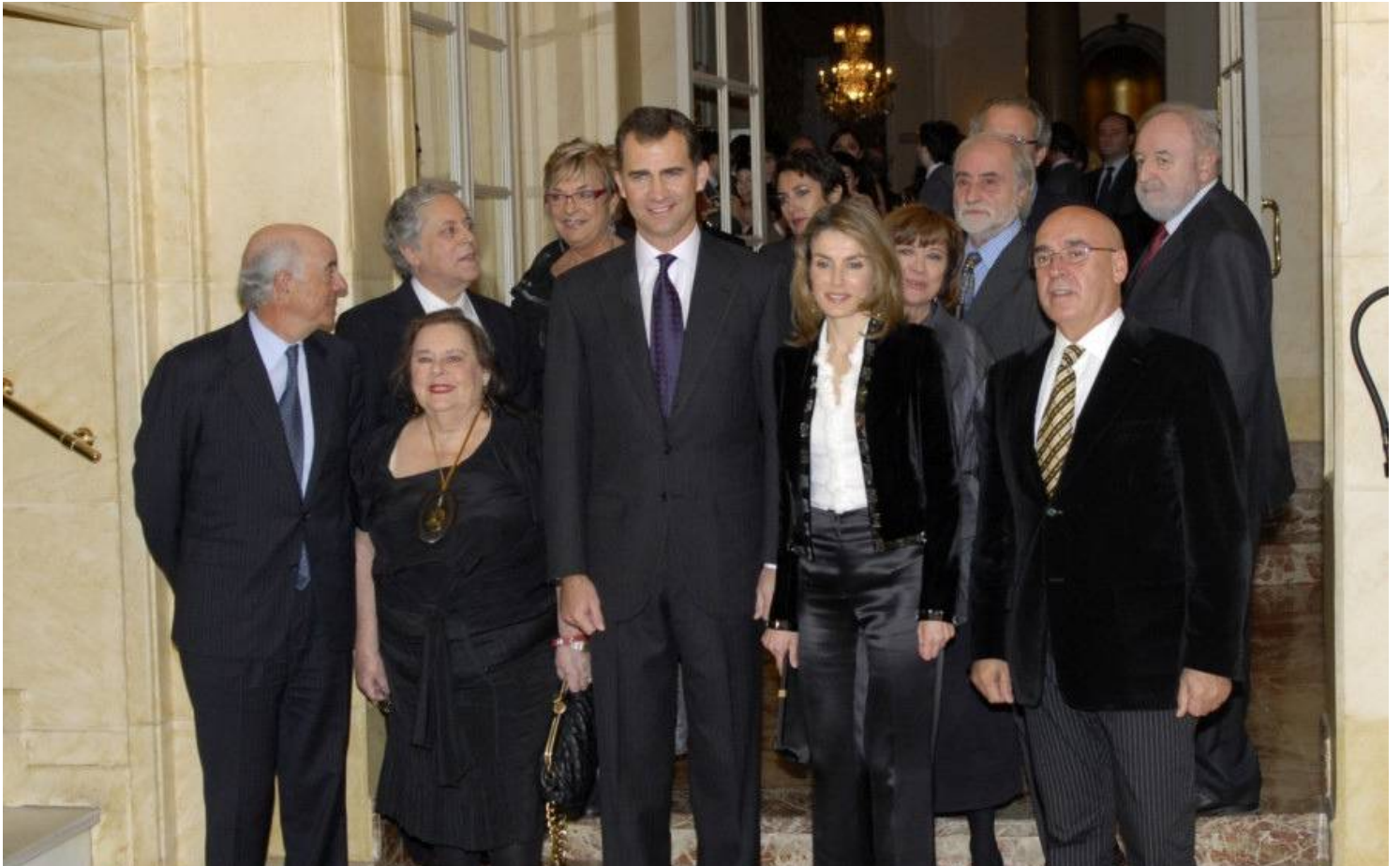
SAR los Príncipes de Asturias posan junto a la galardonada, miembros del jurado, presidente del BBVA y otras autoridades

SAR el Príncipe de Asturias destacó de ella el ser "prototipo de tenacidad desde su juventud universitaria en París, cuando también se afanó en promover el conocimiento de España entre sus conciudadanos estadounidenses y de presentar ante nosotros, los españoles, la no siempre bien conocida realidad del gran pueblo americano".