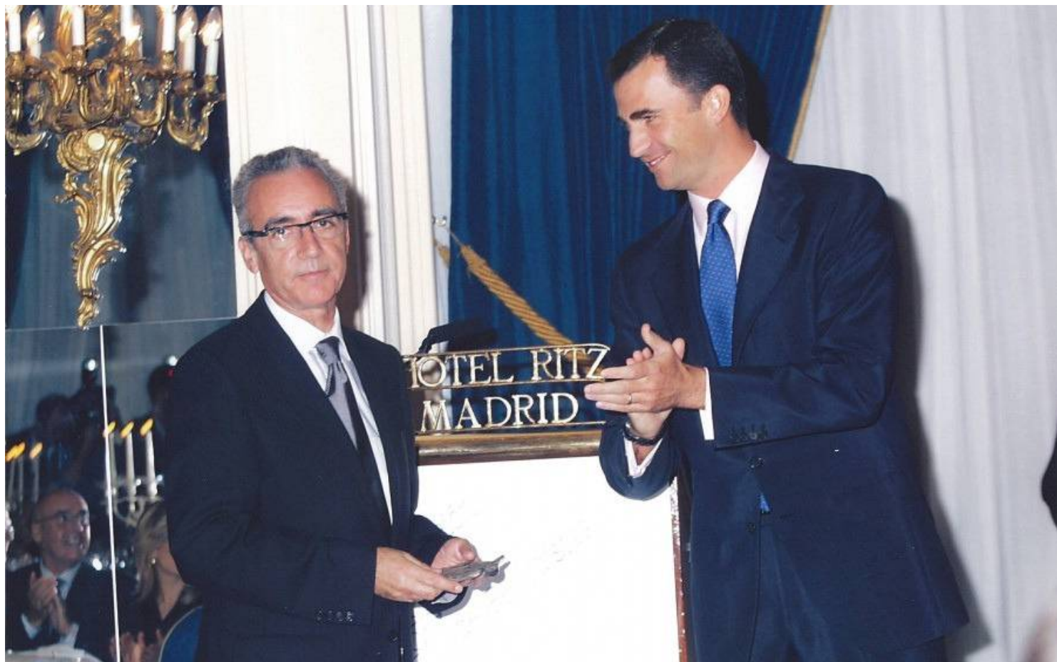
Juan José Millás y SAR el Príncipe de Asturias

S.A.R. el Príncipe de Asturias afirmó que "Juan José Millás domina el género de la columna, tan complejo y delicado para el ejercicio del periodismo como la miniatura lo es para el arte, impregnando sus comentarios de sentido humano"