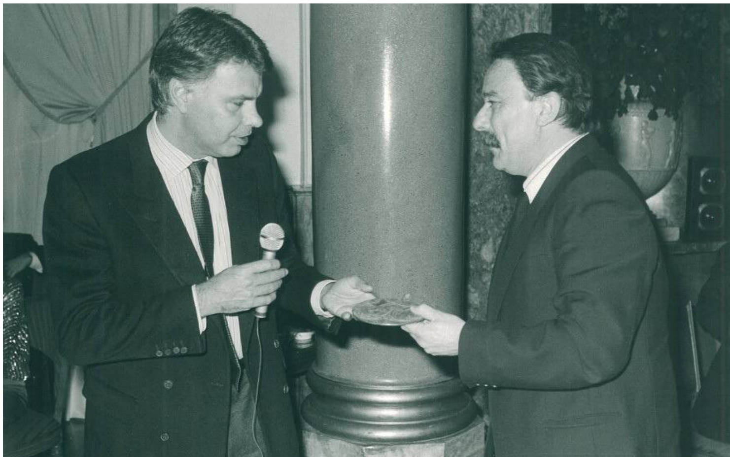
El Presidente del Gobierno, Felipe González, entrega el Premio a Juan Cueto Alas

Según el premiado, "la «voltairiana» figura del idiota en el siglo XXI consiste en sostener que la irreversible globalización es un asunto local, ideológico y maniqueo entre derechas e izquierdas. Es decir, entre minimalismos y maximalismos extraviados de siglo" .