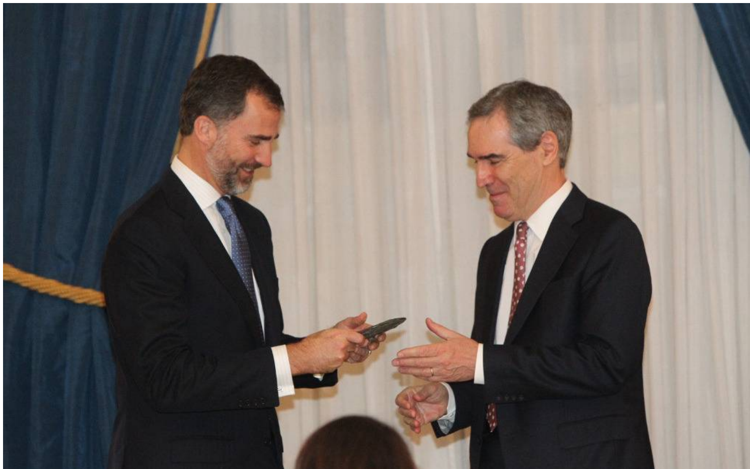
SAR el Príncipe de Asturias entrega el galardón a Michael Ignatieff

El Jurado destacó entre las cualidades de Ignatieff su gran aportación a la superación de las diferencias étnicas y religiosas, sus brillantes trabajos sobre la revolución tecnológica y estratégica tras el fin de la bipolaridad, sus reportajes para la BBC sobre el futuro de la guerra y su firme defensa de la ética y de los valores universales frente al nacionalismo violento.