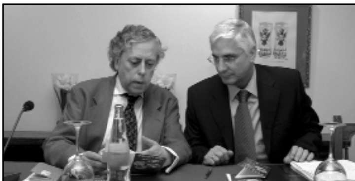
Miguel Ángel Aguilar y José María Barreda