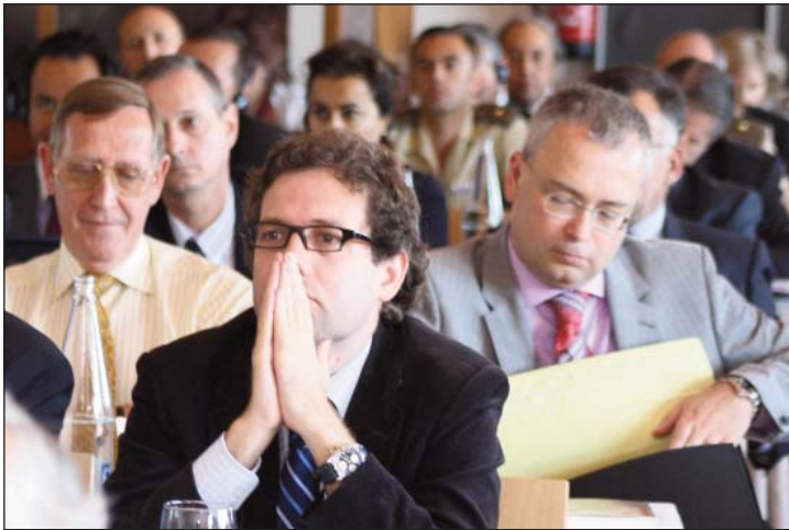
Algunos asistentes al XXIII Seminario Internacional de Defensa

ABED, LISA Corresponsal de la revista Time