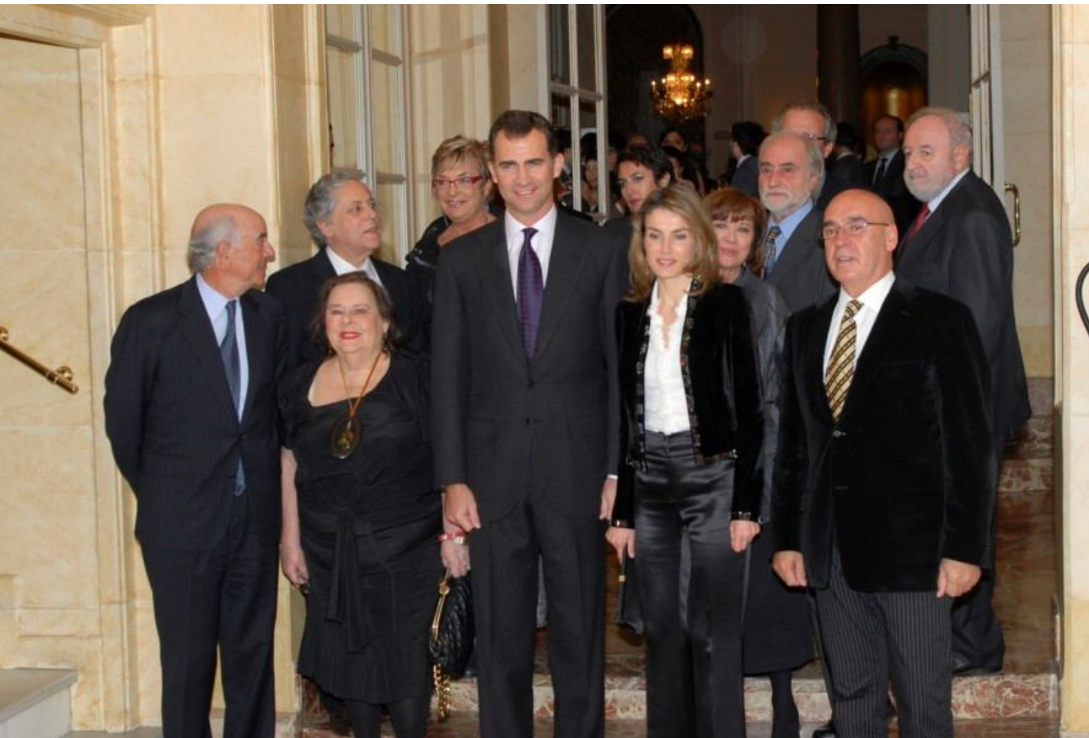
SAR los Príncipes de Asturias posan junto a la galardonada, miembros del jurado, presidente del BBVA y otras autoridades

El Premio fue entregado el 26 de noviembre de 2008 por S.A.R. el Príncipe de Asturias Don Felipe de Borbón acompañado por S.A.R. la Princesa Doña Letizia Ortiz.