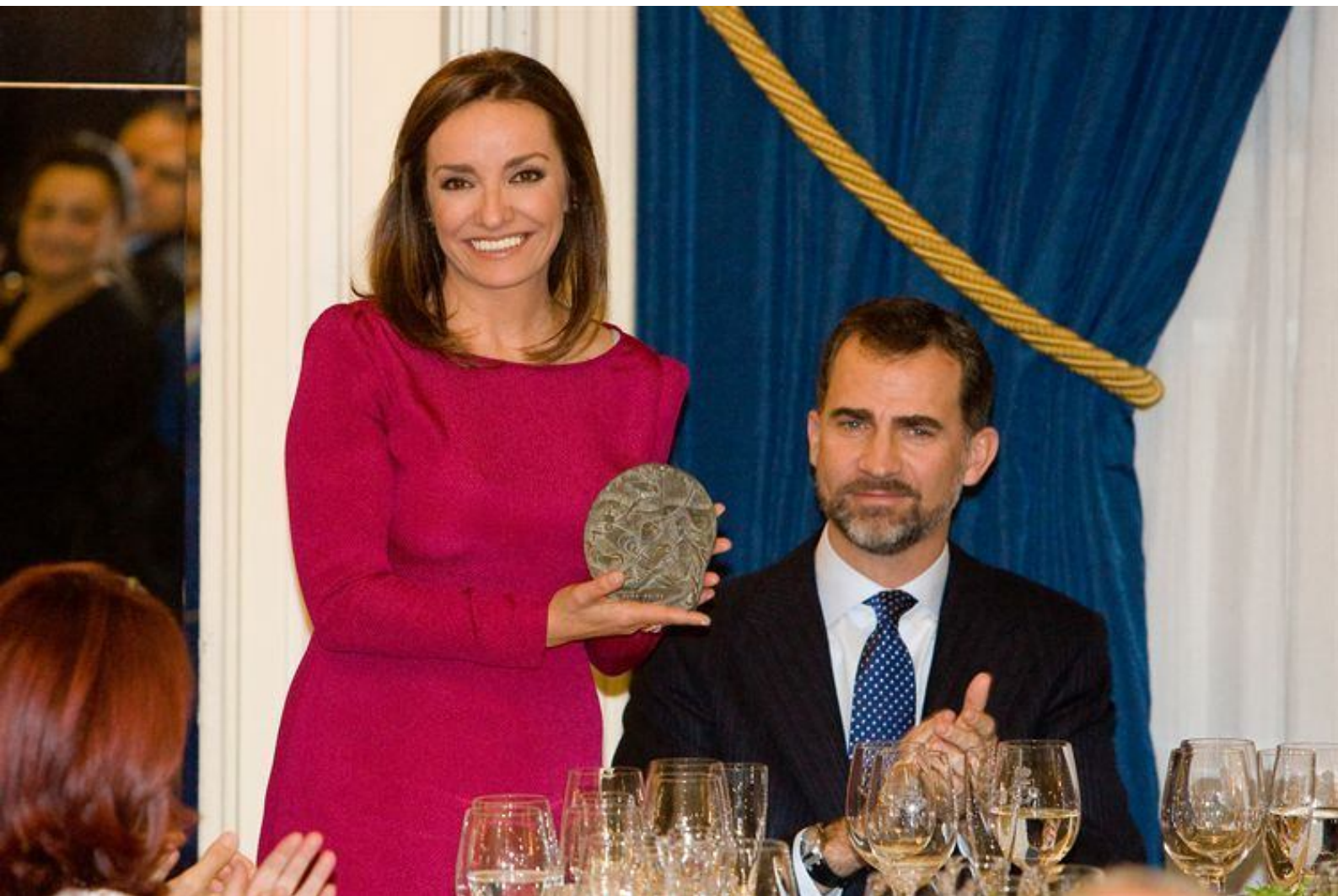
Pepa Bueno muestra la medalla conmemorativa del galardón ante la mirada de SAR el Príncipe de Asturias

El Premio fue entregado el 17 de noviembre de 2010 por S.A.R. el Príncipe de Asturias Don Felipe de Borbón acompañado por S.A.R. la Princesa Doña Letizia Ortiz.