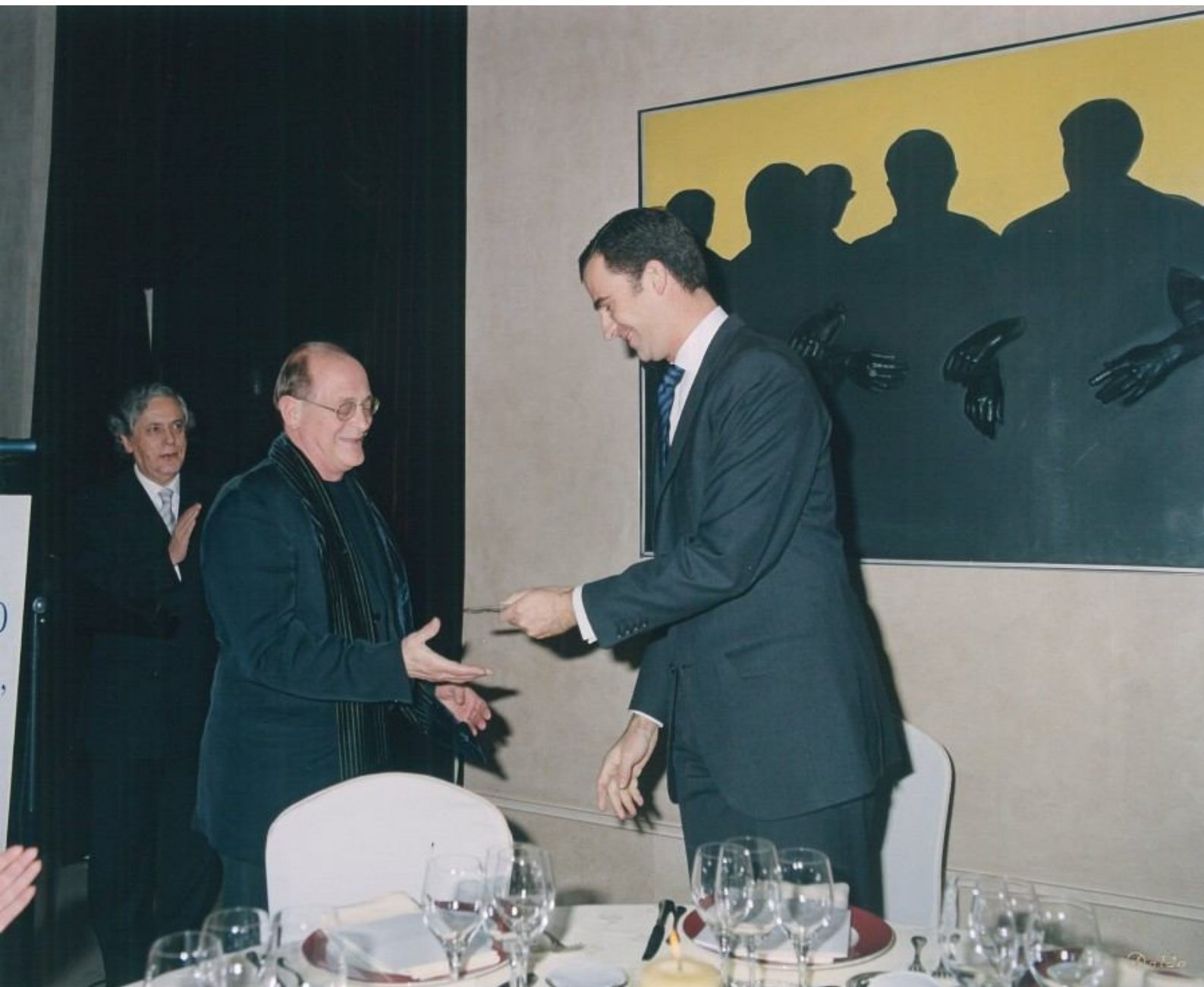
SAR El Príncipe de Asturias Don Felipe de Borbón entrega el galardón a Antonio Tabucchi

El Premio fue entregado el 12 de noviembre de 2004 por SAR los Príncipes de Asturias, Don Felipe y Doña Letizia.