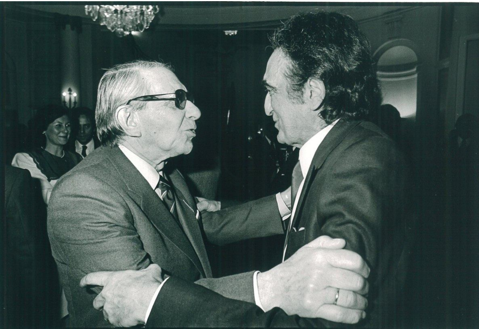
Gonzalo Torrente Ballester y Rafael Sánchez Ferlosio se saludan afectuosamente durante la ceremonia de entrega

El Premio fue entregado el 25 de mayo de 1983 por el Presidente del Gobierno, Felipe González Márquez.