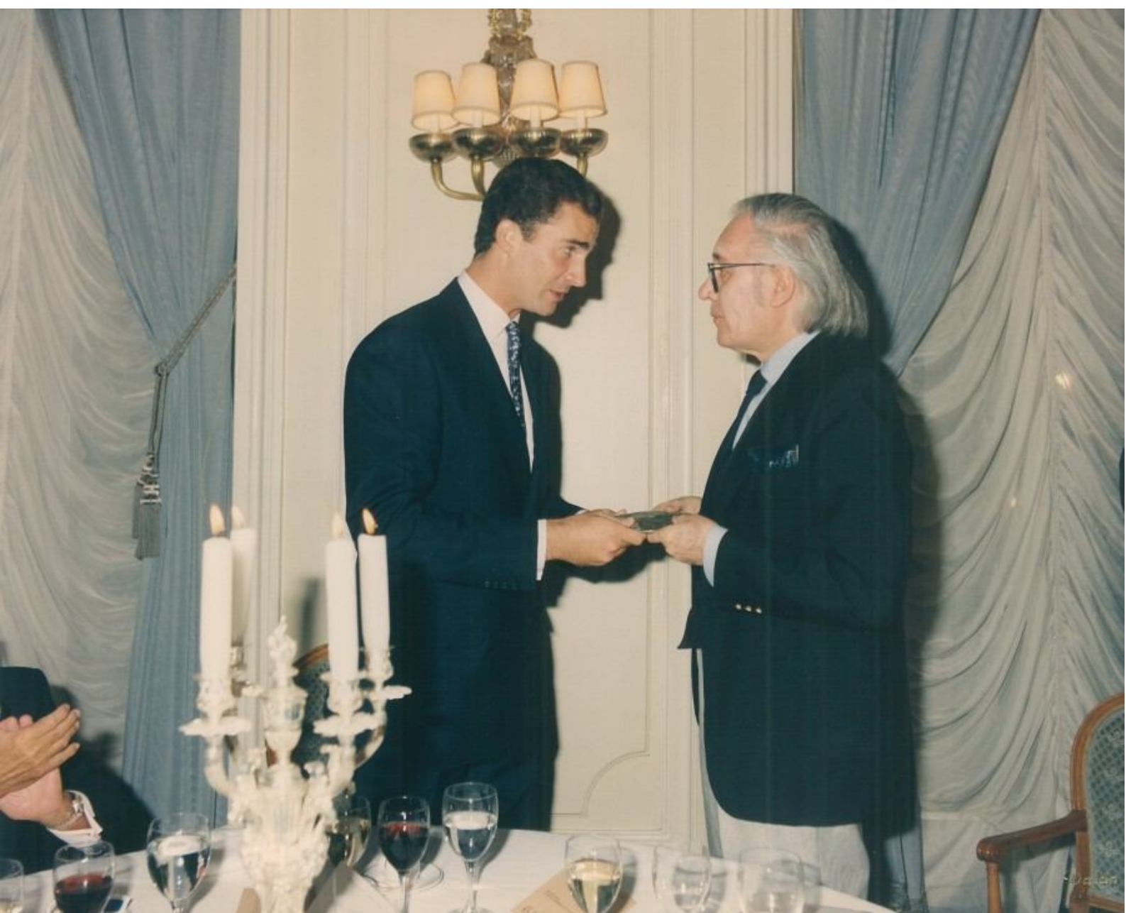
SAR el Príncipe de Asturias entrega la medalla conmemorativa a Francisco Umbral

El Premio fue entregado el 19 de septiembre de 1995 por S.A.R. el Príncipe de Asturias Don Felipe de Borbón.