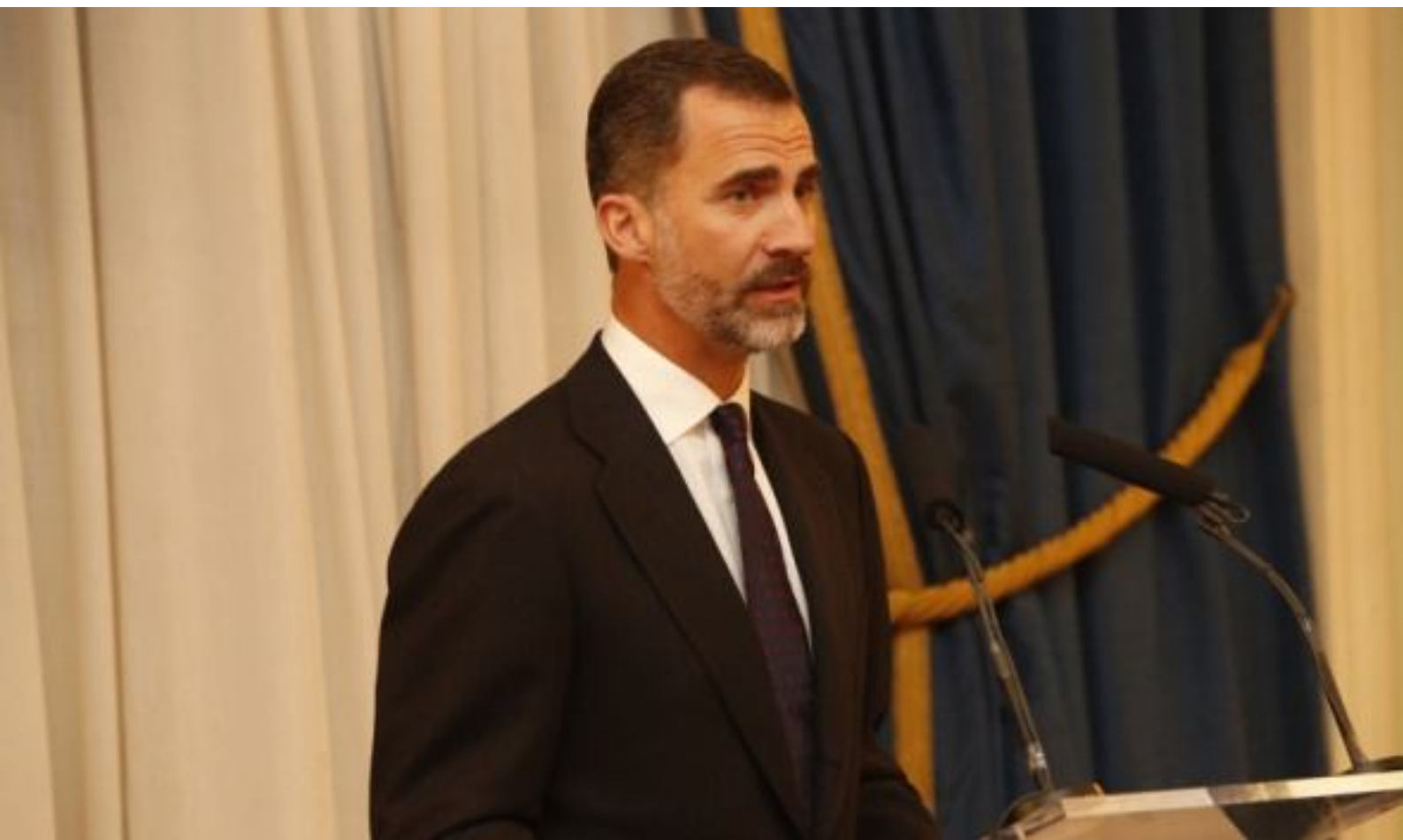
Su Majestad el Rey Don Felipe VI durante la ceremonia de entrega del XXXI Premio "Francisco Cerecedo"

La ceremonia de entrega del Premio se ha visto además extraordinariamente distinguida por el hecho de que a partir de su sexta edición, en 1989, el galardón ha sido otorgado de manos de S.A.R. el Príncipe de Asturias Don Felipe de Borbón , Presidente de Honor de la Asociación de Periodistas Europeos, que continúa entregando el Premio ahora en calidad de Rey de España.