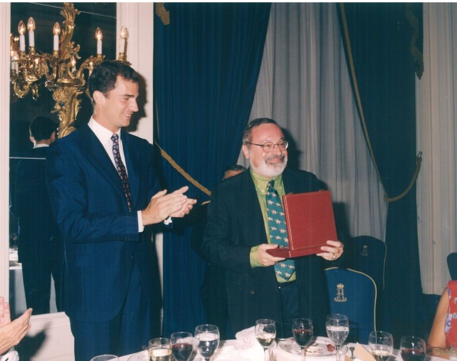
S.A.R. el Príncipe de Asturias Don Felipe de Borbón y Fernando Savater

El Premio fue entregado el 18 de julio de 1997 por S.A.R. el Príncipe de Asturias Don Felipe de Borbón.