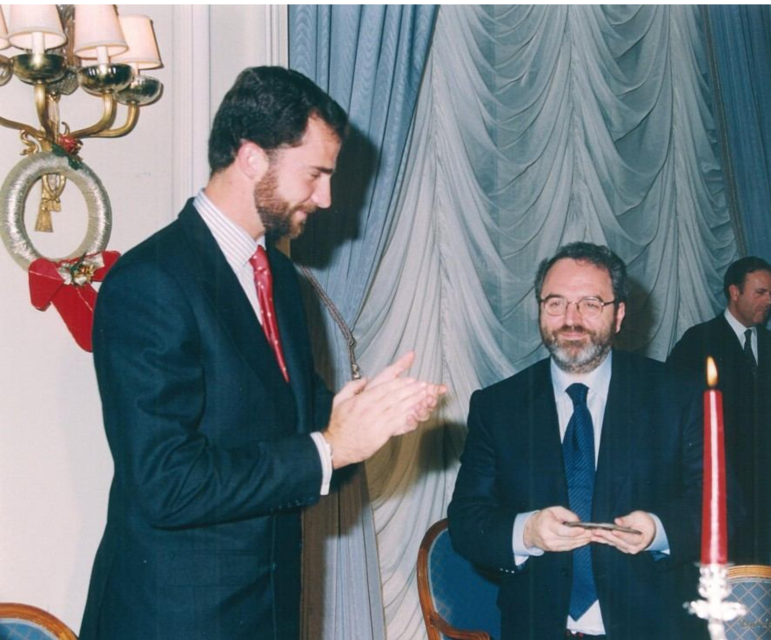
SAR el Príncipe de Asturias Don Felipe de Borbón y Jon Juaristi

El Premio fue entregado el 17 de diciembre de 1998 por S.A.R. el Príncipe de Asturias Don Felipe de Borbón.