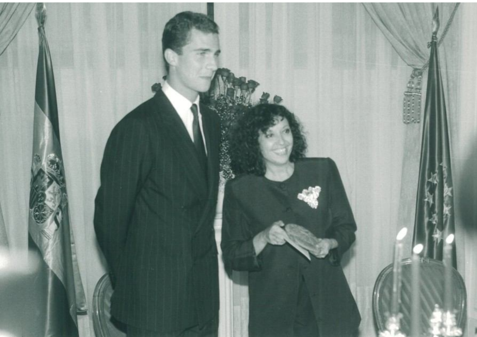
La premiada Maruja Torres posa sonriente junto a SAR el Príncipe de Asturias

El Premio fue entregado el 14 de julio de 1990 por S.A.R. el Príncipe de Asturias Don Felipe de Borbón.