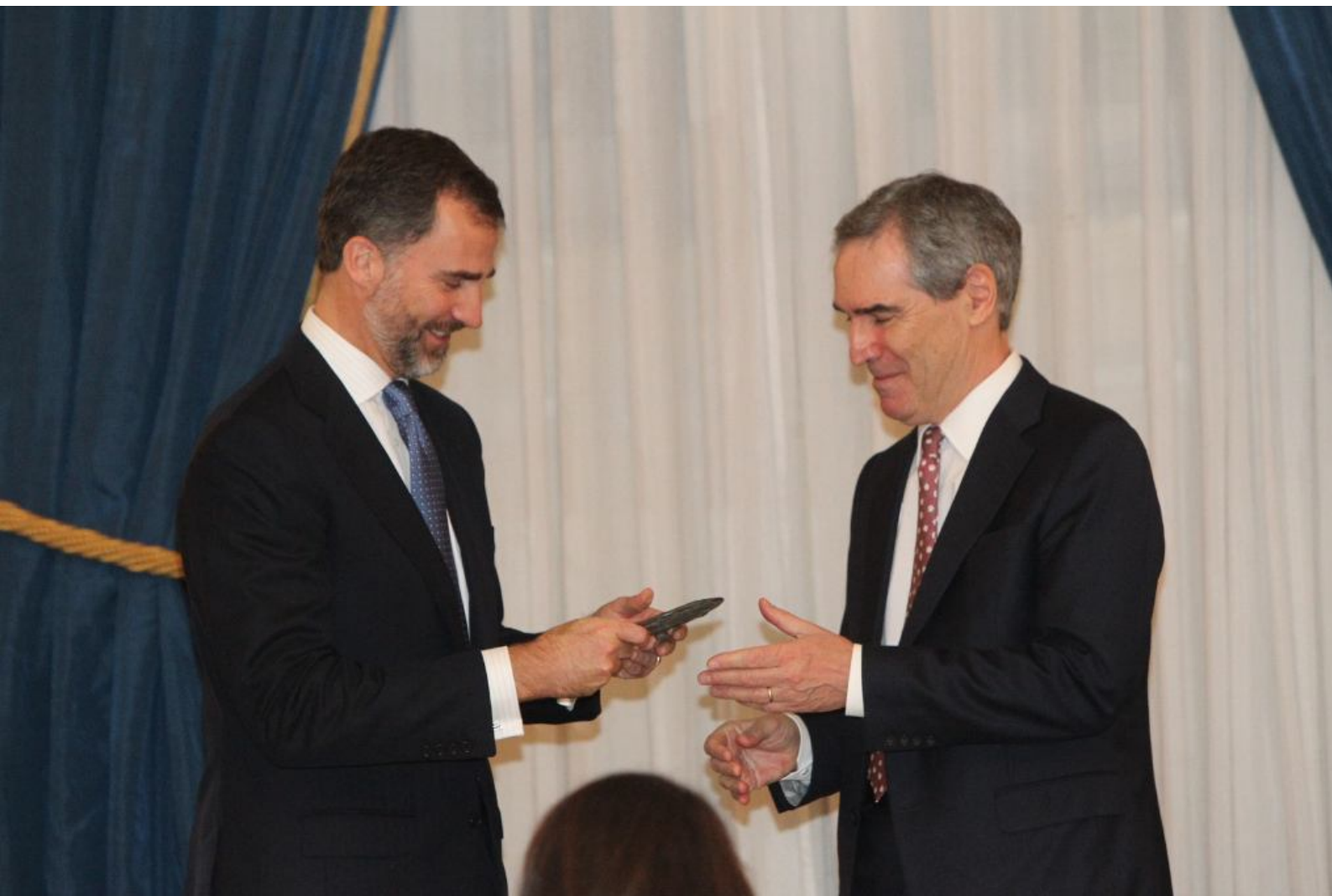
SAR el Príncipe de Asturias entrega el galardón a Michael Ignatieff

El Premio fue entregado el 20 de noviembre de 2012 por S.A.R. el Príncipe de Asturias Don Felipe de Borbón acompañado por S.A.R. la Princesa Doña Letizia Ortiz.