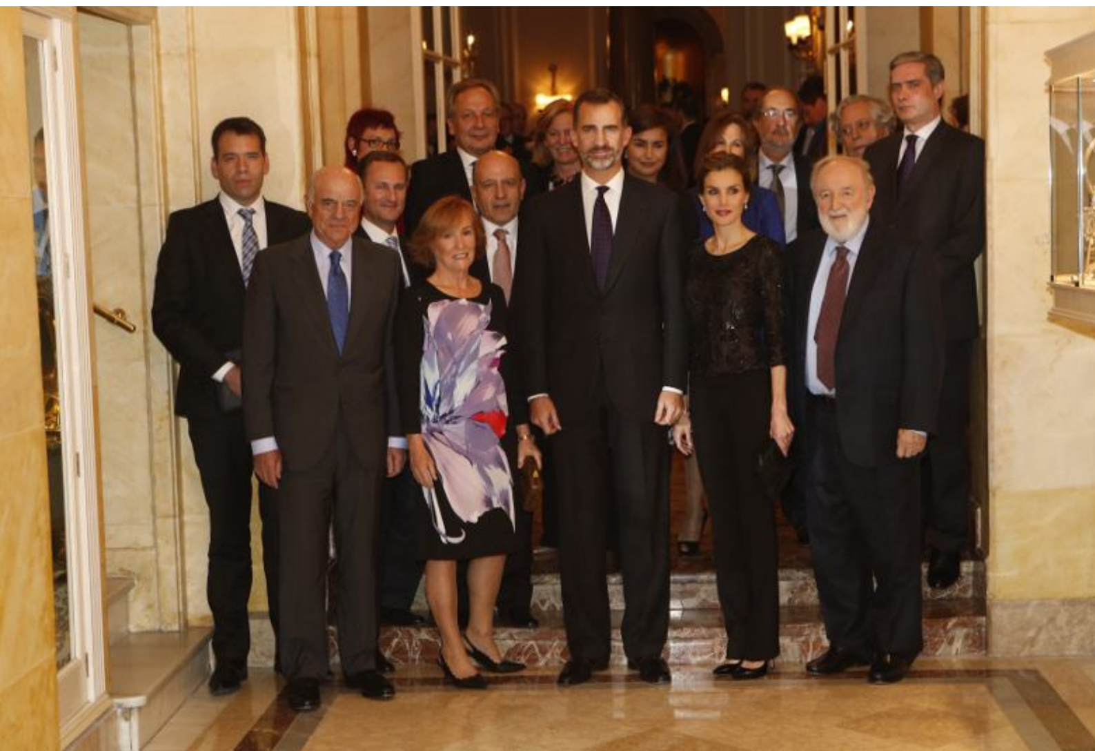
Sus Majestades los Reyes posan con el galardonado, con los miembros del Jurado y el presidente del BBVA

El fallo del jurado se produjo en sesión celebrada en la sede de la APE el 22 de Julio de 2014. El Premio fue entregado el 5 de noviembre de 2014 por Su Majestad el Rey Felipe VI acompañado por SS.MM. la Reina Doña Letizia.