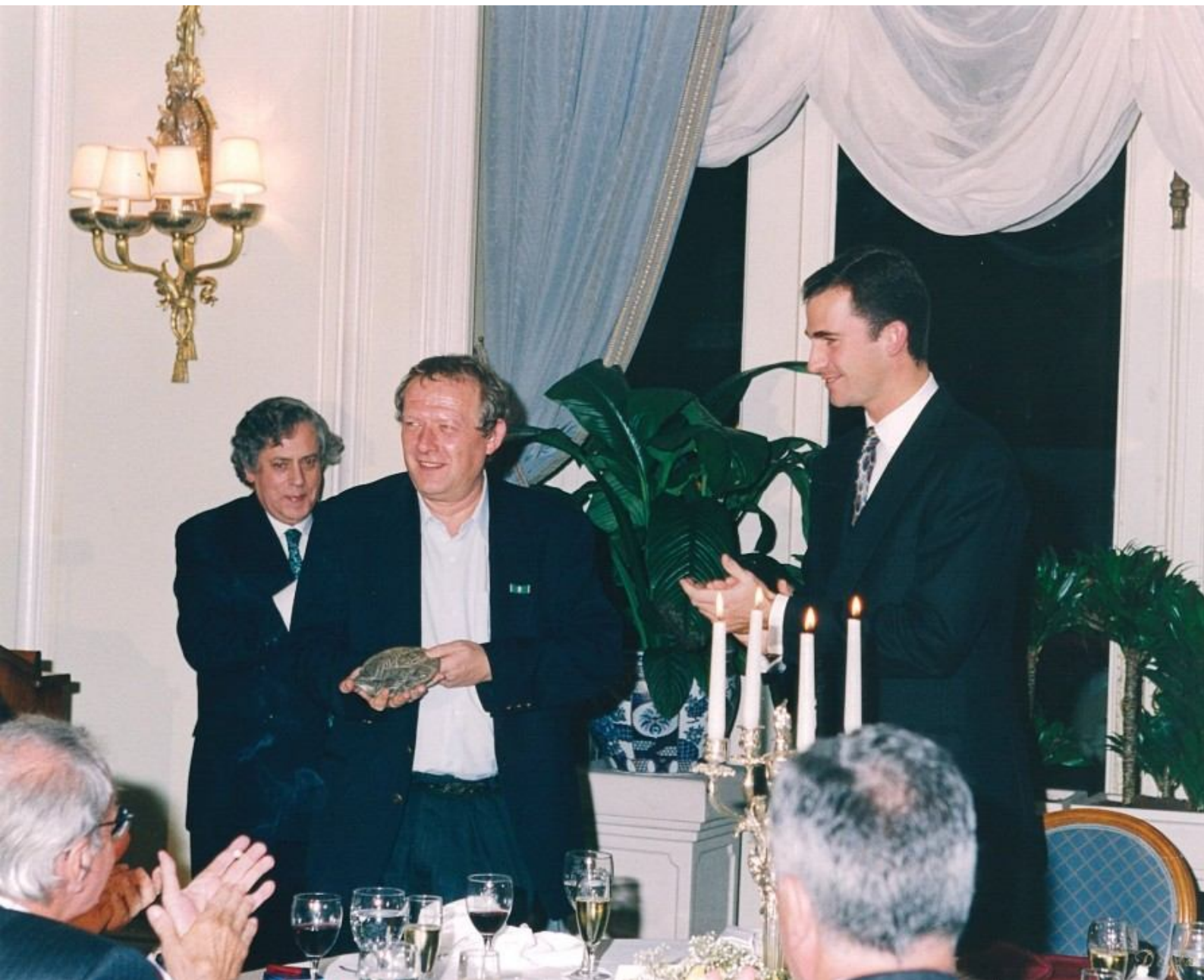
Adam Michnik posa con el galardón y recibe el aplauso de SAR el Príncipe de Asturias

El Premio fue entregado el 25 de noviembre de 1999 por S.A.R. el Príncipe de Asturias Don Felipe de Borbón.