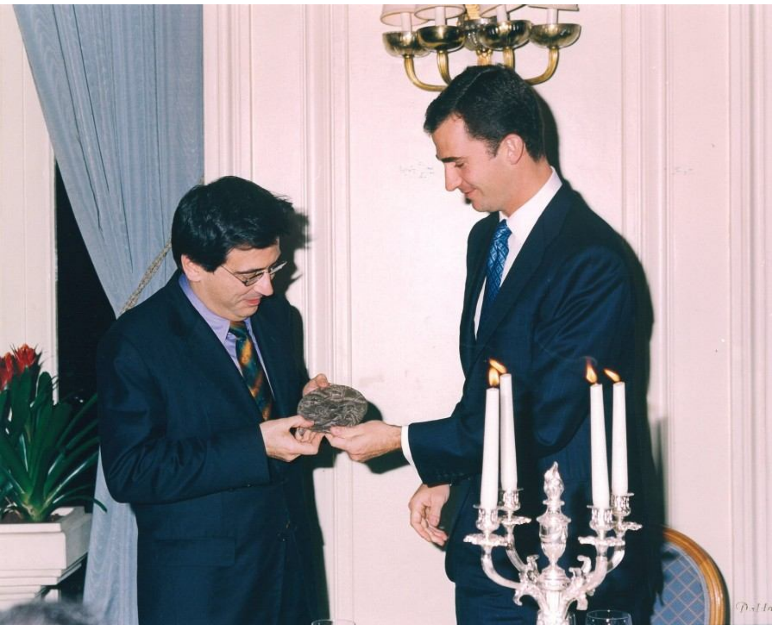
Arcadi Espada y S.A.R. el Príncipe de Asturias Don Felipe de Borbón

El Premio fue entregado el 20 de noviembre de 2000 por S.A.R. el Príncipe de Asturias Don Felipe de Borbón.