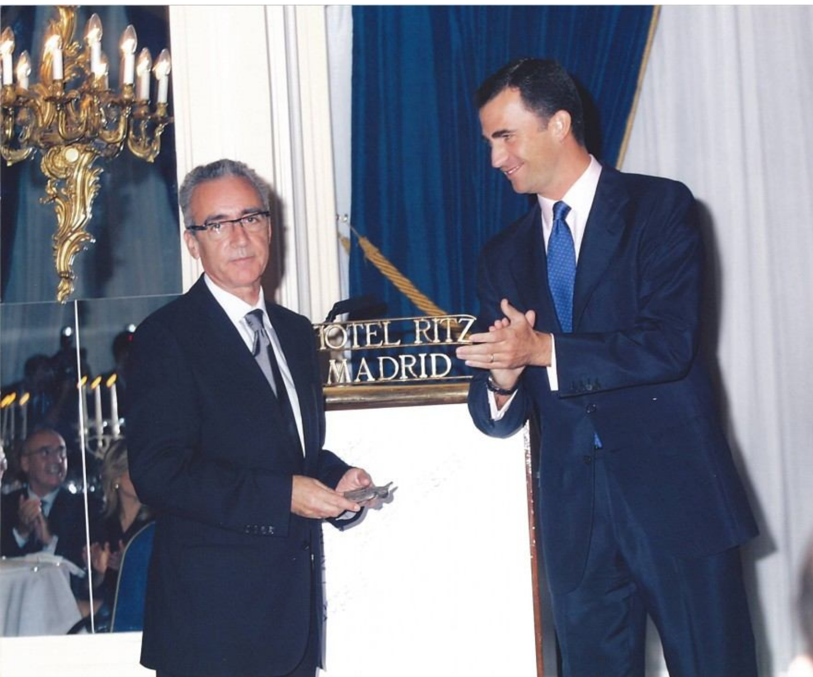
Juan José Millás y SAR el Príncipe de Asturias

El Premio fue entregado el 5 de octubre de 2005 por S.A.R. el Príncipe de Asturias Don Felipe de Borbón acompañado por S.A.R. la Princesa Doña Letizia Ortiz.